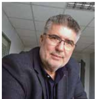
Ο Πρόεδρος της Ο.Σ.Υ.Ν.

Μετά την Γενική Συνέλευση και την εκλογή των οργάνων της Ο.Σ.Υ.Ν. στις 23 Οκτωβρίου 2021, την Τρίτη 2 Νοεμβρίου 2021 σε συνεδρίαση στα γραφεία της ΠΑΝ.ΣΥ έγινε συγκρότηση σε σώμα του Κεντρικού Συμβουλίου και του Εποπτικού Συμβουλίου ως ακολούθως: