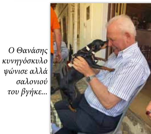
Ο Θανάσης κυνηγόσκυλο ψώνισε αλλά σαλονιού του βγήκε...