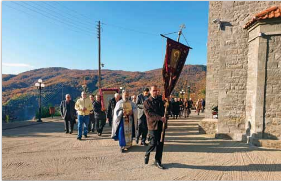
Η περιφορά της εικόνας του Αγίου Νικολάου.