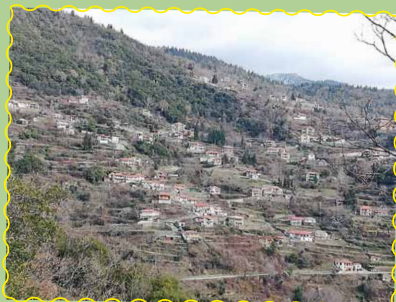
Φωτογραφίες του Γ. Κοντογιάννη