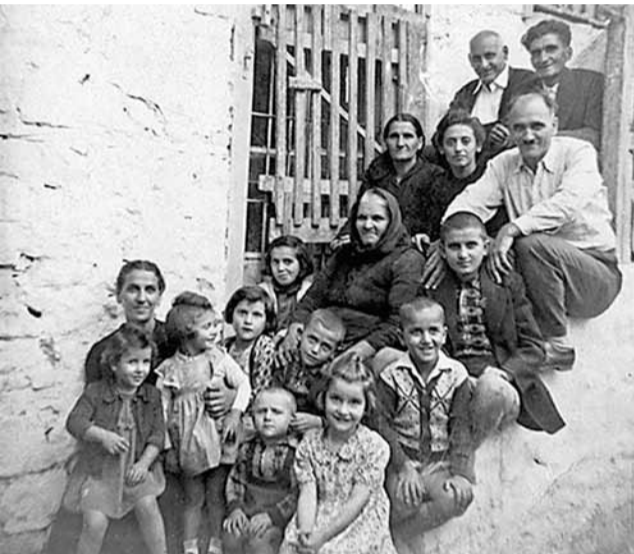
1956 Αναμνηστική οικογενειακή φωτογραφία από την τότε επίσκεψη στο χωριό.

Το 1956 επέστρεψε για πρώτη φορά, από τότε που έφυγε για την Αμερική, στο χωριό να δει τη μητέρα του. Μόλις ένα χρόνο πριν είχε αποβιώσει ο πατέρας του Χρίστος Ι. Κράρας.