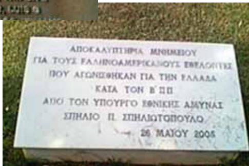
Η ειδική πλάκα στο μνημείο στο Γουδί.