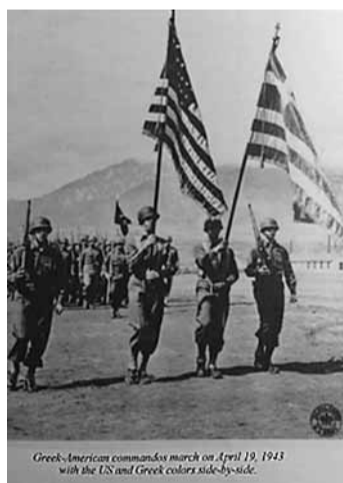
Greek-American commandos march on April 19, 1943 with the US and Greek colors side-by-side.