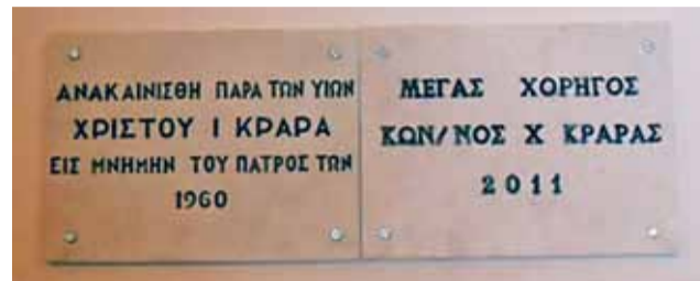
Έτη αρχικών ανακαινίσεων του Εξωκκλησιού.

Παράλληλα δε, ήταν πάντοτε παρών στην οικονομική και υλική υποστήριξη Ιερού Ναού του Αγίου Νικολάου.