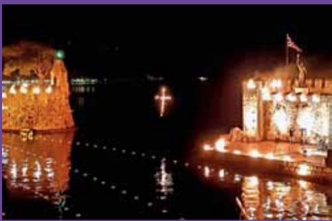
Αναμνα του Σταυρού στην είσοδο του λιμανιού. Το έθιμο στον Επιτάφιο της Ναυπάκτου.