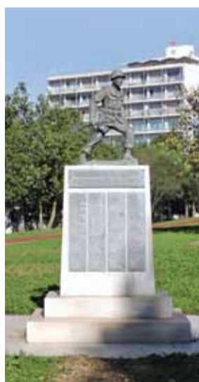
Το μνημείο στο Γουδί.