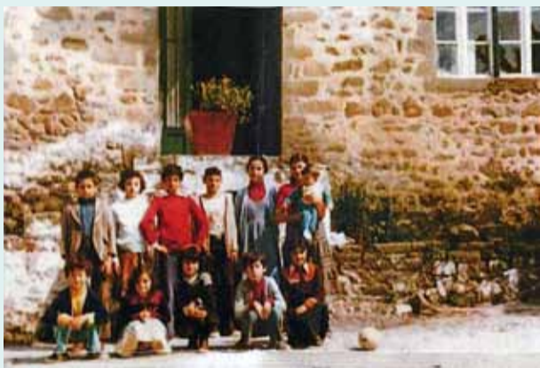
Οι μαθητές με τη σύζυγο και τον υιό του δασκάλου