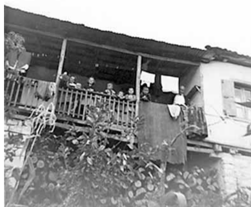
Το σπίτι όπου γεννήθηκε ο Κώστας Κράρας

Κάνοντας μια γρήγορη αναδρομή στη ζωή και το έργο του, αναδεικνύεται ένας άνθρωπος με μεγάλες διακρίσεις, τόσο στον κόσμο των επιχειρήσεων όσο και στην τοπική κοινωνία, την εκκλησία αλλά και στον τόπο καταγωγής του.