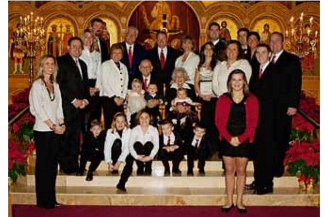
Οικογενειακή αναμνηστική φωτογραφία.