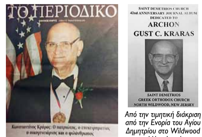
Φωτογραφία από την ειδική αναφορά από την εφημερίδα Εθνικός Κήρυκας της Νέας Υόρκης.

Από την τιμητική διάκριση από την Ενορία του Αγίου Δημητρίου στο Wildwood της Νέας Ιερσής, Αμερικής, για την μεγάλη του προσφορά στην τοπική εκκλησία και στην κοινωνία.