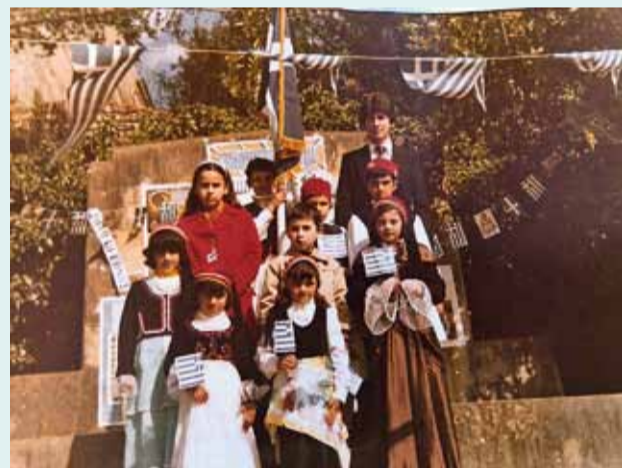
Εθνική εορτή στο Ηρώο

καθώς τον κρατούσε στα χέρια του βυθισμένος σε σκέψεις, πρόλαβε και διάβασε πολλά κι από κάτω μ' αραιά γράμματα τη λέξη καταργήθηκε. Πώς να το πει όμως στους φίλους της; Η μεταλλική της καρδιά δεν το βαστούσε να τους αναφέρει για τη ληξιαρχική τους πράξη θανάτου. Αλλά κι ο δάσκαλος δεν είπε τίποτα, τ' αγαπούσε όλα τόσο πολύ, που δεν ήθελε να τα πικράνει. Πρωτοκόλλησε γρήγορα το έγγραφο και το εμπιστεύτηκε στην ντουλάπα, που έδειξε να καταλαβαίνει. «Καλύτερα να ζουν με την ελπίδα και την προσμονή» είπε μέσα του ο δάσκαλος. Τ' αγκάλιασε όλα με το βλέμμα του, κοίταξε τελευταία την ντουλάπα, που τον έγγνευσε καταφατικά και προχώρησε προς την πόρτα.