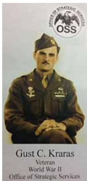
Η επίσημη φωτογραφία από την ένταξή του στην ειδική ομάδα.

Την αποστολή αυτή, την αγνοούσαν ακόμη και τα παιδιά του, έως τα τέλη του 1988, οπότε ένας από τους αξιωματικούς που συμμετείχαν ζήτησε και πήρε άδεια από την αμερικανική κυβέρνηση να γράψει τις αναμνήσεις του. Για τη συνεισφορά του αυτή προς την πατρίδα, τιμήθηκε με σχετικό μετάλλιο από το Γενικό Επιτελείο Στρατού της Ελλάδος, σε ειδική τελετή που έγινε στις 14 Οκτωβρίου 1994, στην στρατιωτική λέσχη Αθηνών. Υπήρξαν εκτενή δημοσιεύματα στον ελληνικό τύπο, (Εφημερίδα τα «Νέα», 15 Οκτωβρίου 1994, και Οικονομικός Ταχυδρόμος, 29 Σεπτεμβρίου 1994). Για την προσφορά της μονάδας αυτής στον αγώνα κατά των γερμανών υπάρχει και ειδικό μνημείο στο Γουδί όπου και αναφέρονται τα ονόματα όλων των αγωνιστών.