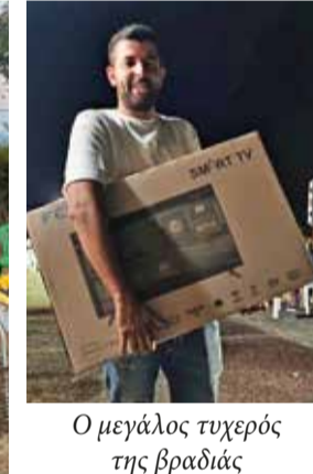
Ο μεγάλος τυχερός της βραδιάς